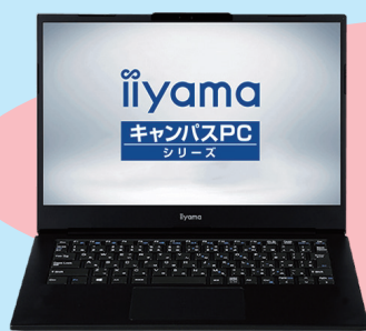
Type I01 Windows 11 Home