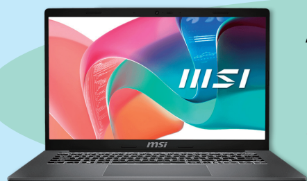
Type M01 Windows 11 Pro

※3月中旬以降に購入をした場合は、納品が初回の授業に間に合わない場合があります。