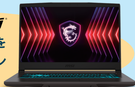
Type M02 Windows 11 Pro

動画編集・画像編集ソフトや学習アプリなどを 高速・快適動作させるハイスペックノートパソコン